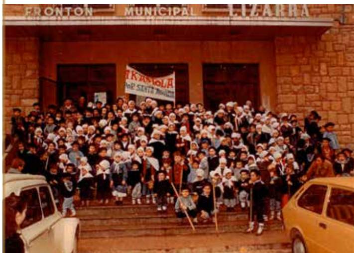
Lizarra Ikastolako ikasleak Lizarra frontoiko eskaileretan Santa Ageda eguneko ospakizunean.

Amets hura egia bihurtu zen 1970eko irailaren 29an, hogeita bost haur inguruk euskararen biderei hasiera eman ziotenean Udalak utzitako Lizarra Frontoiko gela batean.