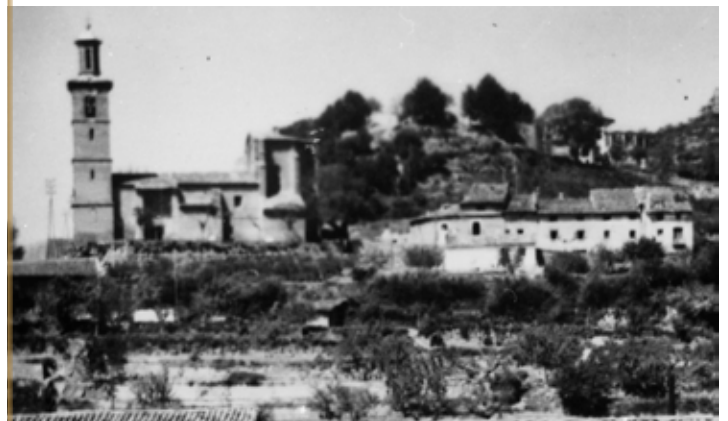
Lizarra auzoa XX. mendearen hasieran.

Zernahi gisa ere, Lizarra «auzoko» hizkuntza nagusia zein zen adieraztean, zalan-tza gutxi dago historialarien artean, eta zalan-tza gutxi ondoko mendeetan ere bai: eus-kara nagusia zen bertako laborari eta artzain xumeen eguneroko bizitzan.