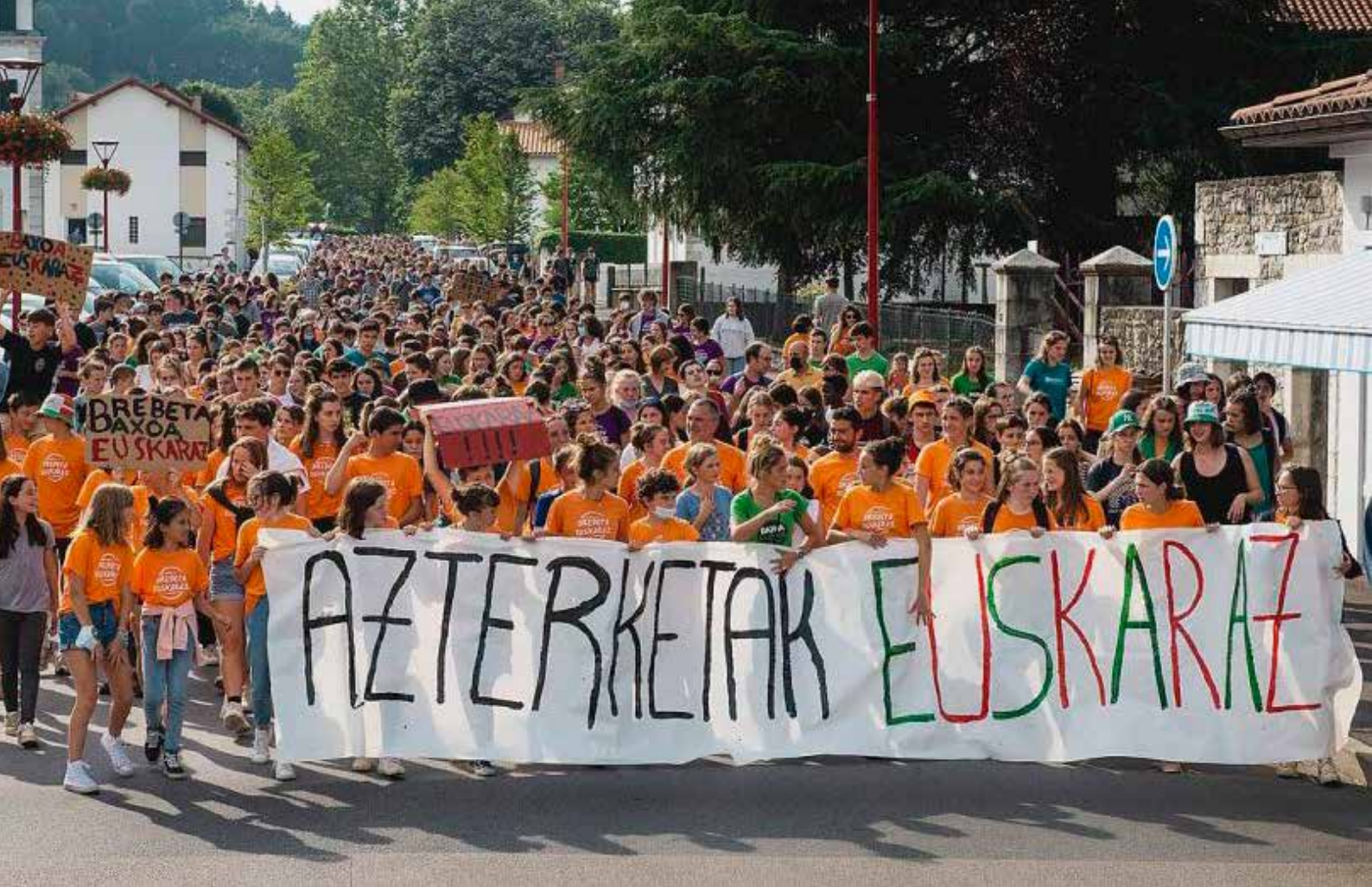
Azterketak euskaraz, Donapaleu (2021eko uztaila).