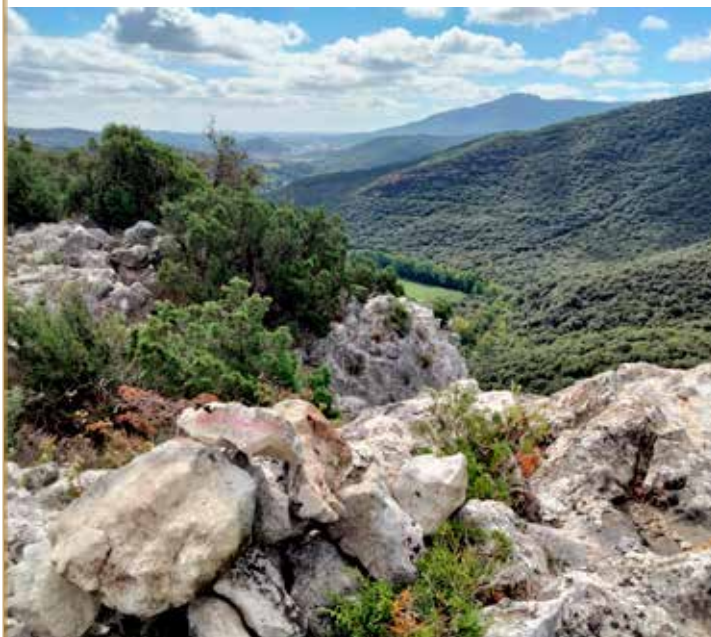
Bargagorriko gaina; eskuinean, Belastegiko mendi-hegalak; urrutian, Jurramendi.