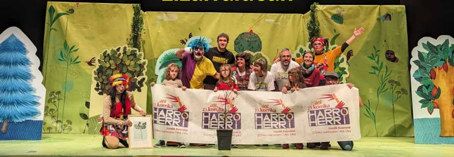
Gareanen eskutik Katxiporreta Los Llanosen otsailaren 7an

Lasterka egin aurretik zein ondotik komeni da beroketa ariketak eta luzaketak egitea. Bada, berdin egiten du Korrikak, lasterka egin aitzin Korrika Kulturala ziztu bizian dator.