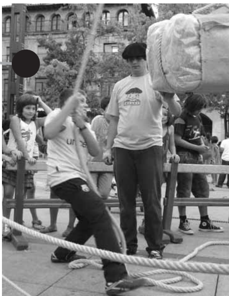
KULKIren saioa Lizarrako Foru plazan festetako bezperan.

Kalitatezko zerbitzua emateko, behinik behin, bezeroari bere hizkuntzan artatua izateko aukera eman beharko litzaioke. Hortaz, barneratu eta zabaldu beharko genukeen ideia dugu elkarrizketetan aipatutako silogismoa: “turismoa ona da Lizarrarako, euskara ona da turismorako, beraz...”. Ikusita bisitarien jatorria, honakoa gaineratu genezake ere: No parlo català però m'agradaria que tu ho poguessis fer. Si m'ajudes podré atendre't encara que no pugui contestar en català. Moltes gràcies i benvingut, ets a casa. Zergatik ez jarri horrelako kartel bat negozioan?